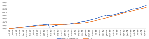
GRÁFICO DE DESEMPENHO

TRIBUTAÇÃO IR/Esse imposto incidirá no último dia útil dos meses de maio e novembro de cada ano ("come cotas"), ou no resgate se ocorrido em data anterior, observando-se, adicionalmente, o seguinte: enquanto o FUNDO mantiver uma carteira de longo prazo, como tal entendendo-se uma carteira de títulos com prazo médio superior a 365 dias, o imposto de renda será cobrado às alíquotas de: 22,5% prazo de até 180 dias, 20,0% prazo de 181 até 360 dias; 17,5% em aplicações com prazo de 361 até 720 dias; 15,0% em aplicações com prazo acima de 720 dias.